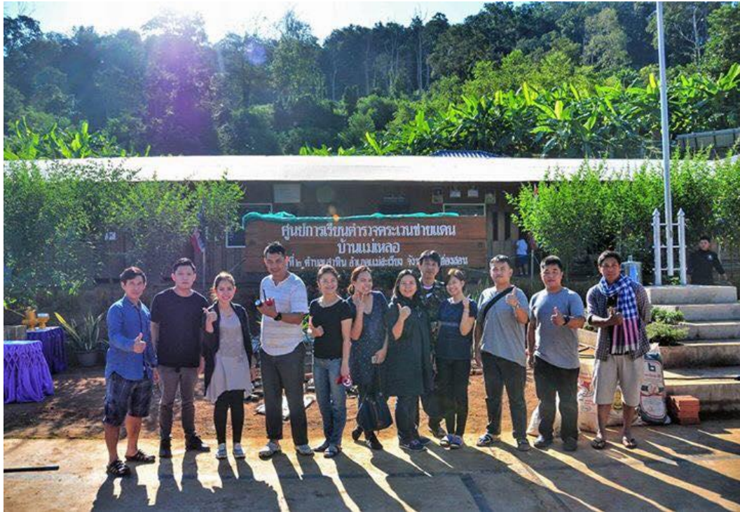
คณะกรรมการโครงการสหวิทยาการเพื่อพัฒนาเยาวชน ประจำปี 2564 คณะมนุษยศาสตร์และสังคมศาสตร์